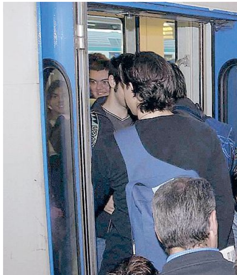
TRENO L'episodio è accaduto sulla linea ferroviaria Empoli-Siena, subito dopo la stazione di Barberino Val d'Elsa

Istituto alberghiero della provincia di Firenze. «La settimana scorsa sul treno Empoli-Siena, si è verificato un grave atto di bullismo — spiega la donna —. Era appena stata superata la stazione di Barberino Val d'Elsa, il treno era affollato di ragazzi che tornavano a casa. Un ragazzo quindicenne di Poggibonsi, al centro di un gruppetto di 'amici', scherzando e ridendo con loro giocava con un accendino, dopo aver mosso la fiamma continuamente in modo da riscaldare la parte metallica dell'accendino stesso, ha afferrato, all'improvviso e senza nessun motivo, il braccio della ragazza che era seduta alla sua destra dall'altro lato del corridoio, anche lei quindicenne, e gli ha pressato sopra con for-